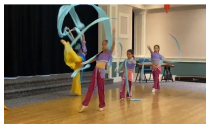
Chinese New Year Celebration Shannon Oaks Retirement Home