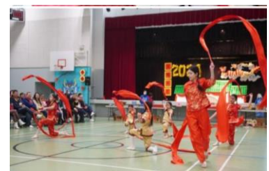
Chinese New Year Celebration SFX Parish