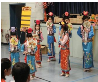
Special Event Celebration Corpus Christi Parish Celebration