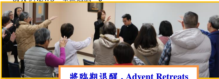
將臨期退醒 . Advent Retreats