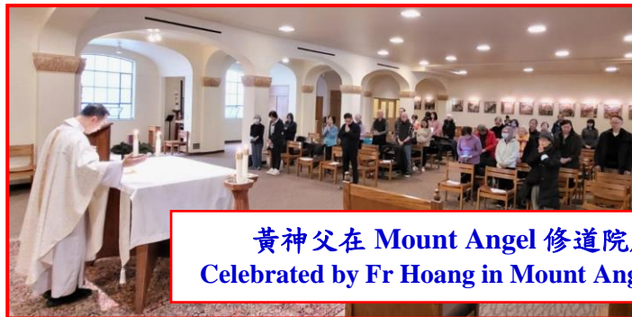
黃神父在 Mount Angel 修道院慶祝 Celebrated by Fr Hoang in Mount Angel Abbey