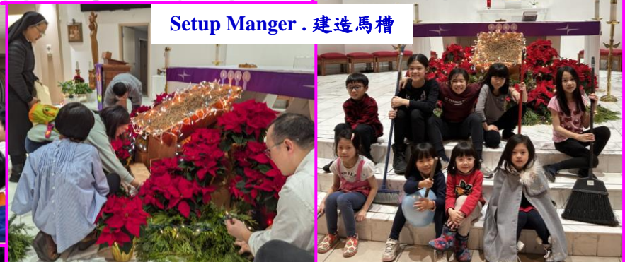
Setup Manger . 建造馬槽