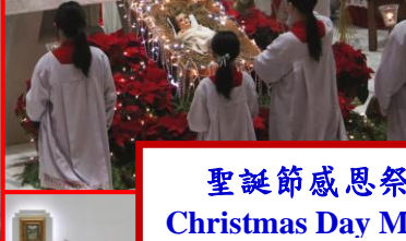
聖誕節感恩祭 Christmas Day Mass