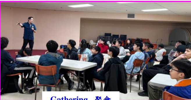
Gathering . 聚會