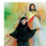
—耶穌要修女將祂「顯現的像」畫出來 ST. FAUSTINA